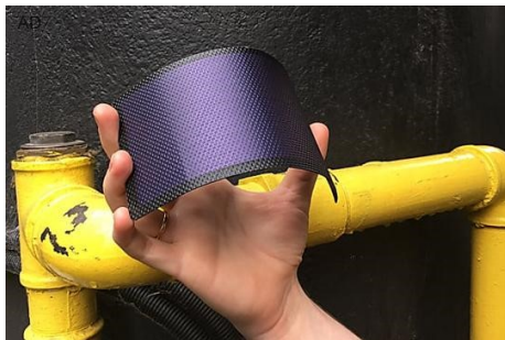
Il governo può pagare gli italiani per passare agli impianti solari The Eco Experts