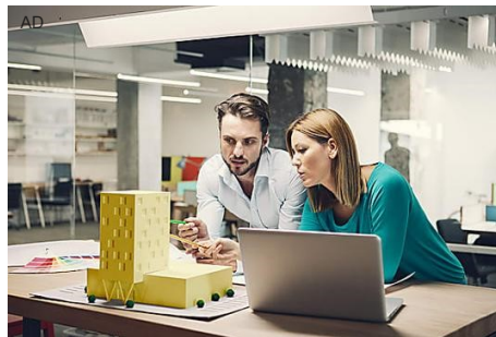
Non rimandare la tua formazione! Corsi per professionisti e Internet illimitato Fastweb e UNIPRO