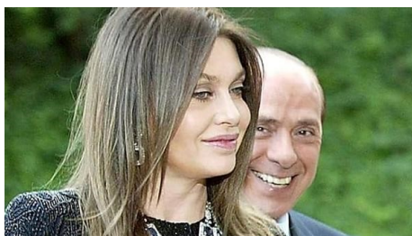
Giudice: Cav proceda con pignoramenti