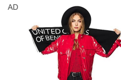
Energia, colore e stile contemporaneo: scopri il nuovo universo pop di... United Colors of Benetton